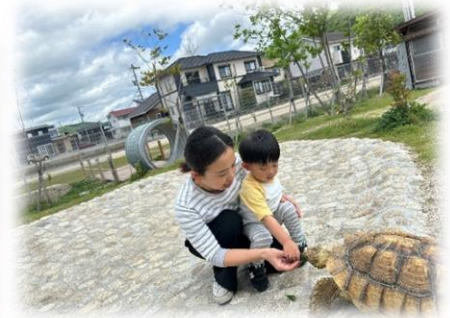
動物とのふれあい