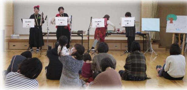
地域の方とのふれあい