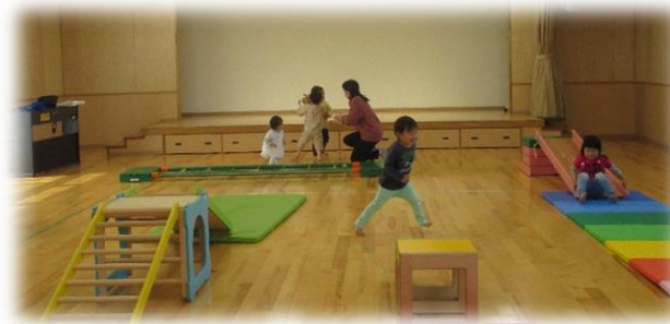
ホールで運動遊び