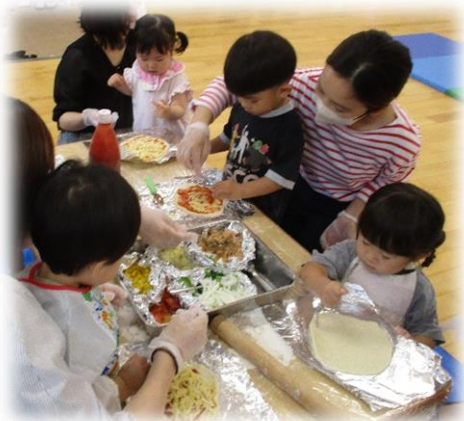
畑で採れた野菜 でピザ作り