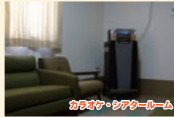
カラオケ・シアタールーム

ウォーターベッド型マッサージ機を設置。好きな音楽を聴きながら、心身のリフレッシュにご活用ください。