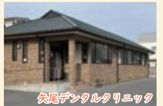
矢尾デンタルクリニック