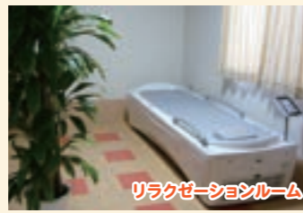
リラクゼーションルーム

介助が必要な方も安心してご入浴いただけるよう、介助浴槽を完備。ご状態に合わせて一般浴・介助浴・特殊浴からお選びいただけます。